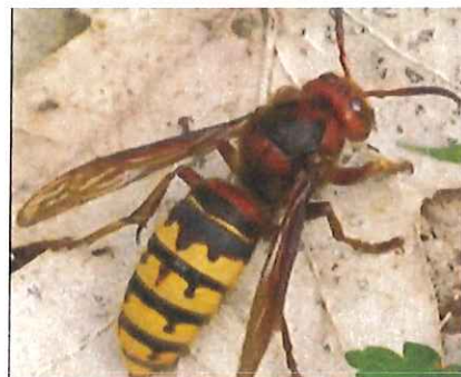
Frelon européen et autres insectes