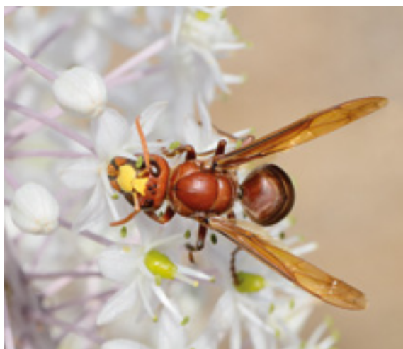
Frelon orientalis

Période d'activité : adultes observables en vol d'avril à novembre 5 .