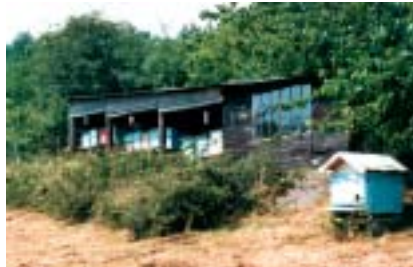
C'est beau mais il y a des marches.

Pour vos voisins, nous allons éditer très prochainement, dans le cadre du programme européen, un petit dépliant expliquant l'intérêt d'avoir un apiculteur près de chez soi. N'hésitez pas à en commander au CARI dès maintenant.