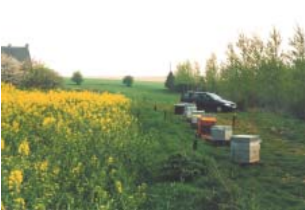
Rucher très facile d'accès

régions. On estime en général qu'un rucher ne doit pas comporter plus de douze ruches, sauf si l'environnement mellifère est particulièrement riche. Il faut également tenir compte de la distance entre les ruchers, surtout si ces derniers sont importants. Il faudrait au moins garder une distance de six cents mètres entre deux ruchers.