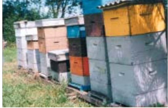
Rucher bien ensoleillé

Chez les abeilles, les interactions avec l'environnement sont beaucoup plus nombreuses que chez d'autres animaux. Il faut donc veiller à respecter leurs besoins essentiels sous peine de connaître de nombreux déboires.