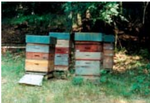
Rucher avec trous de vol dans les 4 directions

On dit également qu'il faut des ruches bien aérées pour éviter la condensation. C'est vrai si les ruches ne sont pas exposées aux vents (dominants). Ceux-ci sont surtout préjudiciables en hiver ou lors du démarrage printanier. Une ceinture de végétation (haies, arbustes...) autour des ruches peut créer un microclimat favorable. Pour choisir un bon emplacement, un petit truc consiste à rechercher les endroits où la neige fond rapidement.