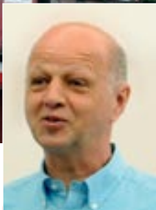
WERNER VON DER OHE