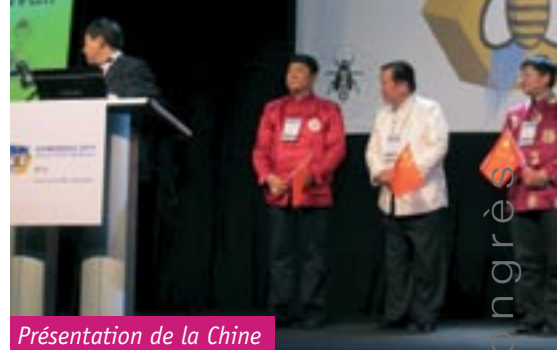
Présentation de la Chine

présenter tous les cadeaux qu'ils feraient aux délégués (voyage et nuits d'hôtel gratuites...) pour les convaincre de voter pour eux alors que les Chinois, par fair-play, étaient restés discrets. Suite à une plainte très virulente, ils ont pu en finale distribuer un dépliant qui présentait également les avantages offerts par la Chine. C'est donc dans un climat très tendu que s'est déroulé le vote qui a sélectionné la Corée du Sud comme candidat 2015. Il est bien malheureux d'en arriver à une telle surenchère pour convaincre les délégués de voter en faveur d'un candidat plutôt que d'un autre. C'est l'image d'Apimondia qui en souffre directement.