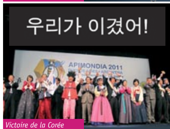
Victoire de la Corée